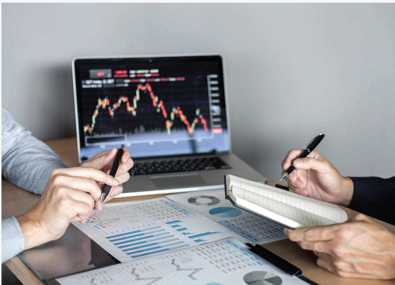
*Fotografía con fines ilustrativos