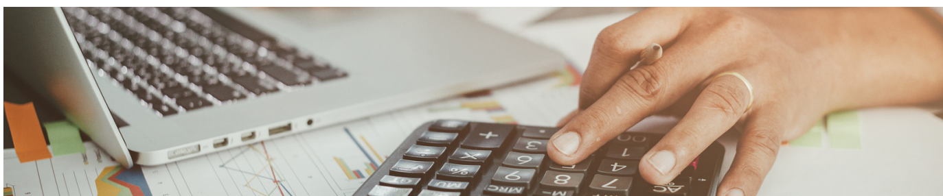
*Fotografía con fines ilustrativos