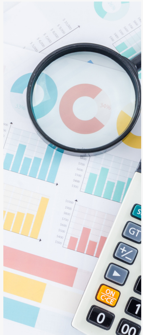
*Fotografía con fines ilustrativos

En consecuencia, a lo largo de 2023, la CMF llevó a cabo un proceso de consulta en el que participaron varios actores del sistema financiero a través de mesas de trabajo. Durante este proceso, la Asociación de Fondos Mutuos (AFM) destacó la importancia de contar con profesionales acreditados y propuso mejoras en este ámbito. Como resultado, en enero de 2024, el regulador emitió normativas que implican cambios en el registro, la autorización y la acreditación de conocimientos, marcando así un hito en la regulación del servicio de asesoría de inversión.