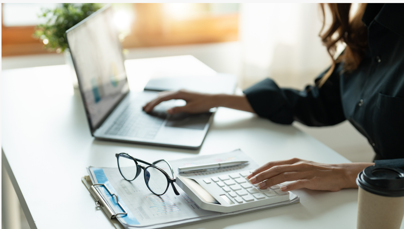
*Fotografía con fines ilustrativos

En particular, se espera que estos cambios faciliten una mayor oferta de fondos y permitan a sus administradores aprovechar de manera más ágil las oportunidades de mercado en beneficio de los inversionistas.