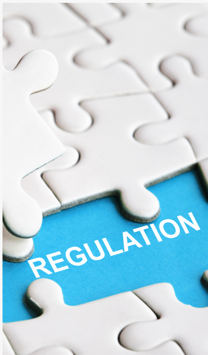
*Fotografía con fines ilustrativos